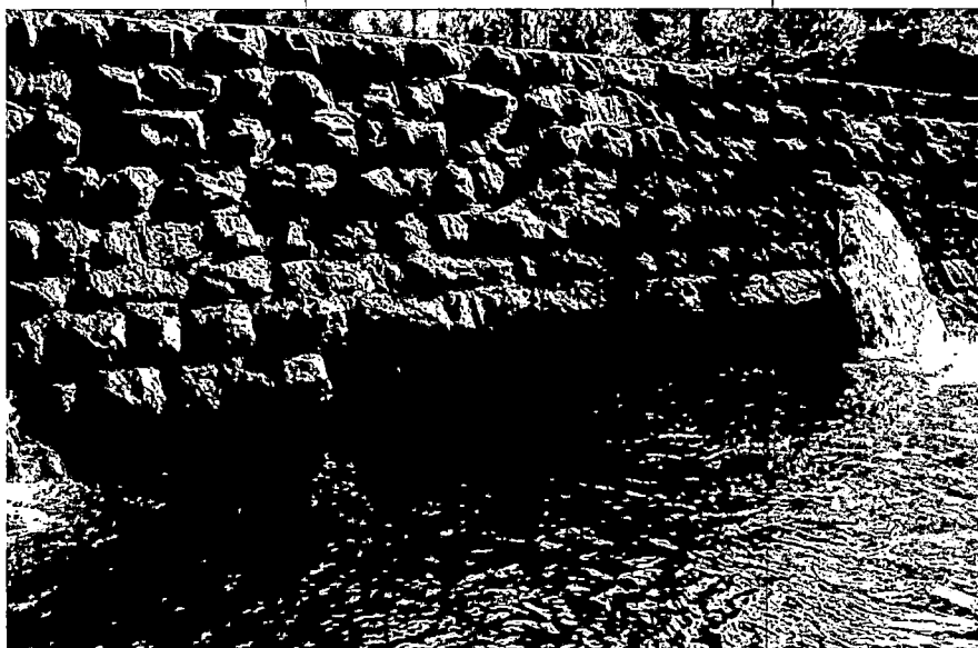
Слика 4: Оштећења низводне стопе преграде