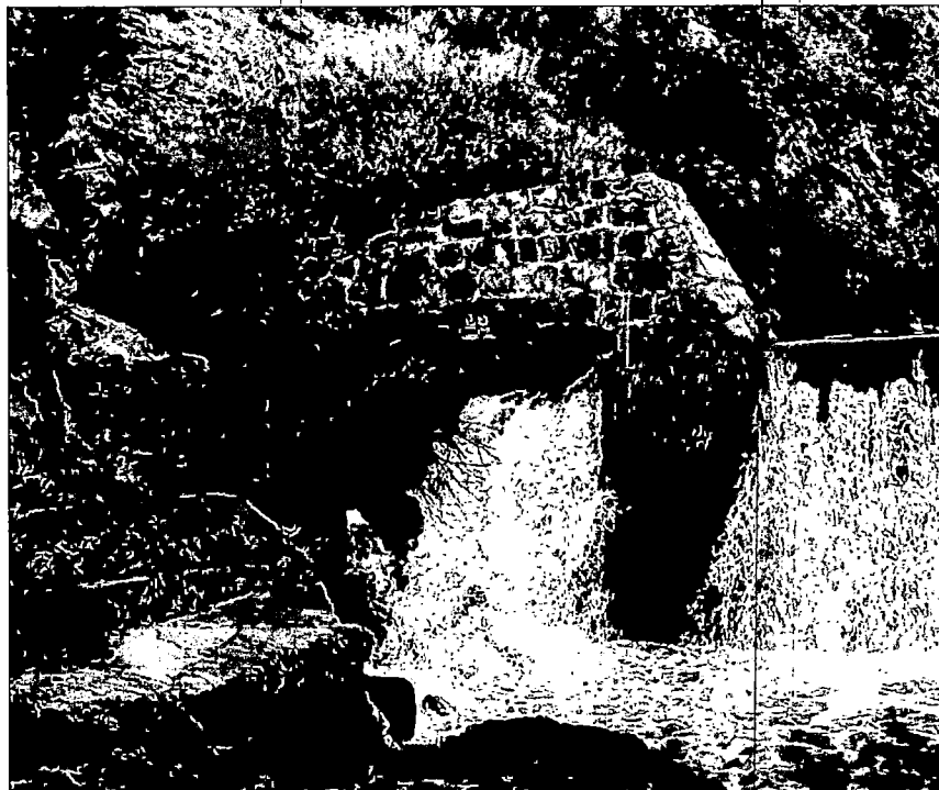
Слика 3: Деградиран десни бок – поглед са низводне стране