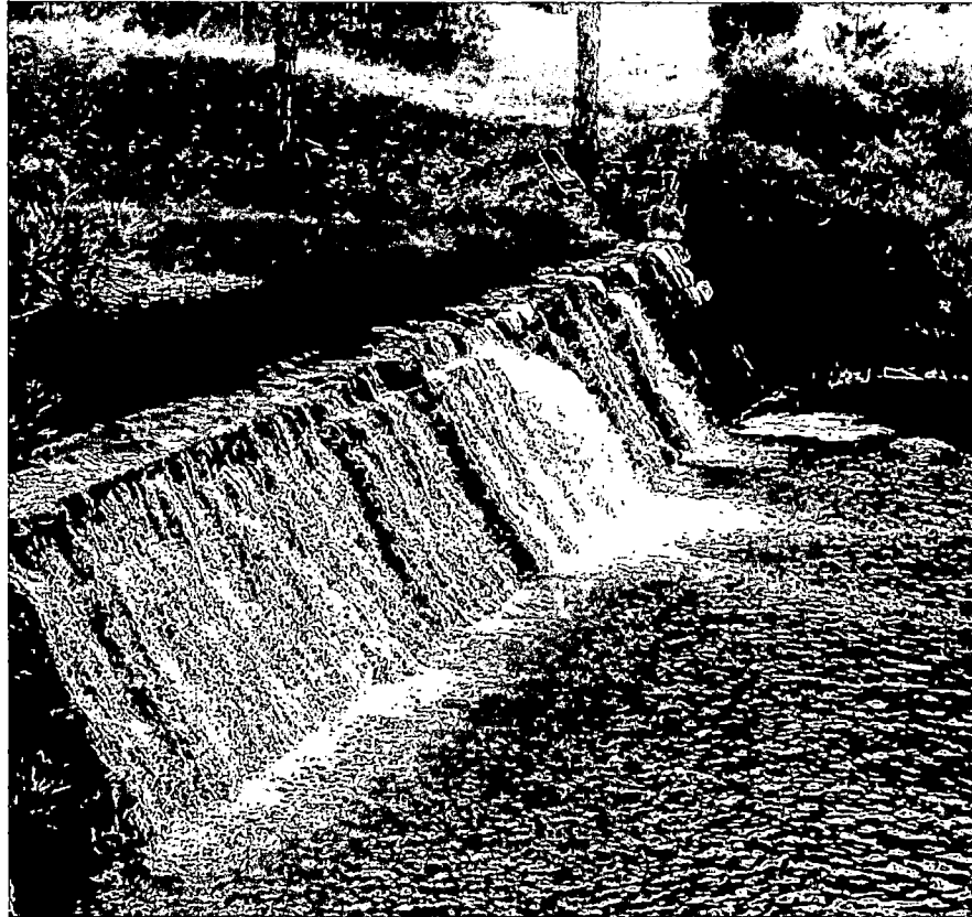
Слика 5: Оштећења врха преливног дела преграде